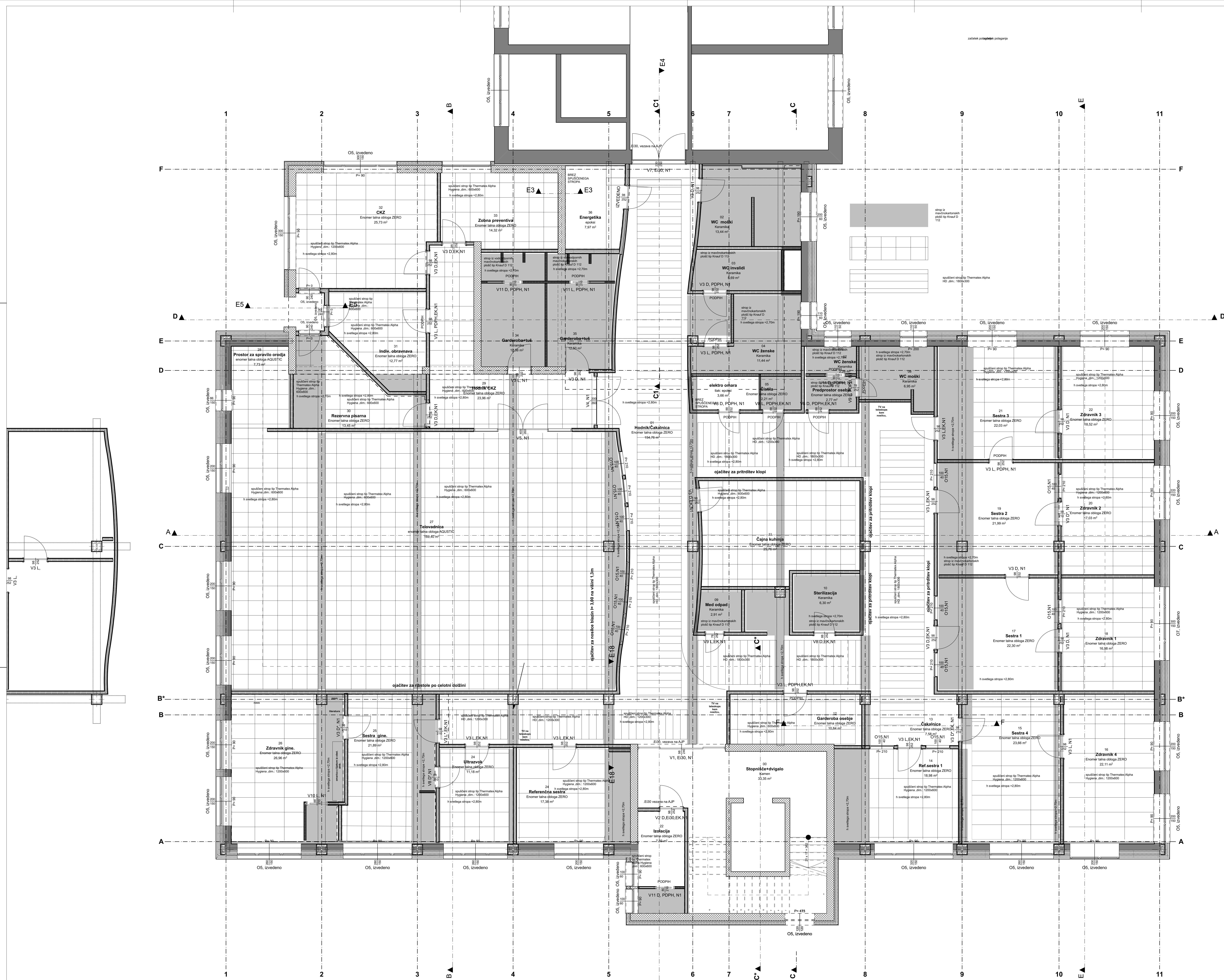
LEGENDA PROSTOROV - 1. Nadstropje